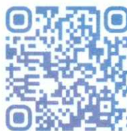
При поступлении учитываются индивидуальные достижения абитуриента