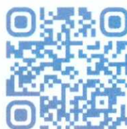
Все, что нужно знать о поступлении, размещено здесь