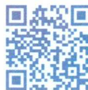
Как проходят Дни открытых дверей?